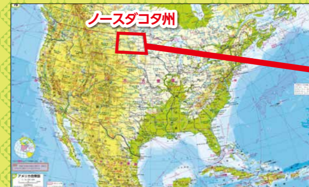
▲アメリカ合衆国内の取材先

“アメリカの心臓部”とも呼ばれる中西部にある ノースダコタ州 の産業のようすを2023年8月に取材しました。