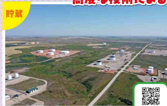
▲⑦小麦畑の近くに建てられた石油タンク