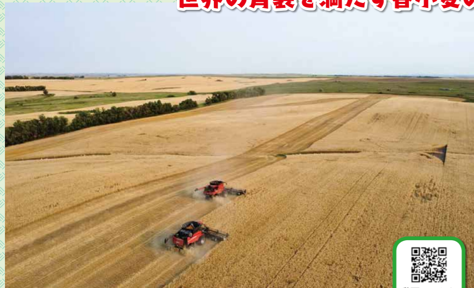
▲①コンバインによる小麦の収穫(ドローンによる撮影)