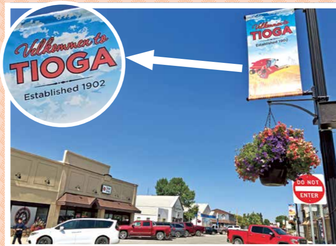
▲⑪タイオガの街並。デンマーク移民が造った街であり、街のポスターにはデンマーク語も使われている。