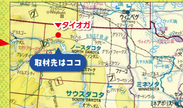
▲ノースダコタ州内の取材先