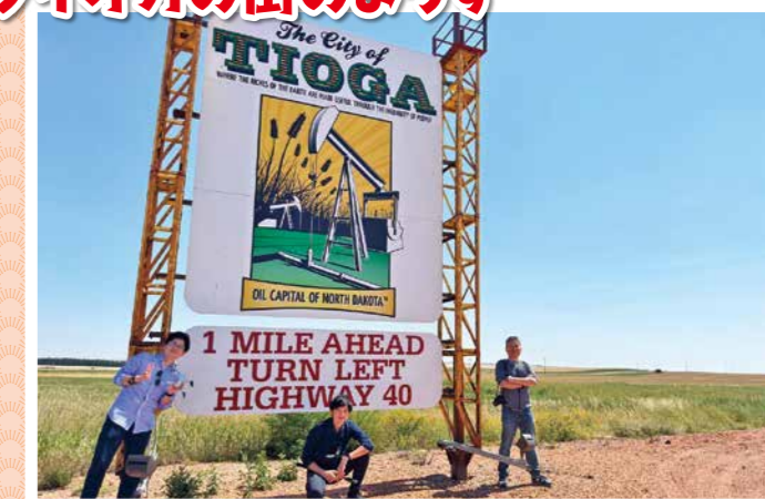
▲⑩小麦と石油採掘のイラストが描かれた看板(人物は取材班)