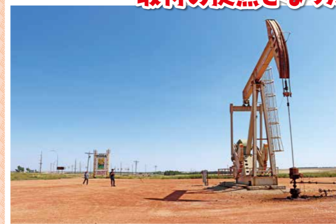
▲⑨石油採掘のシンボルとしての採掘機