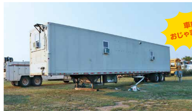
▲⑤トレーラーハウス