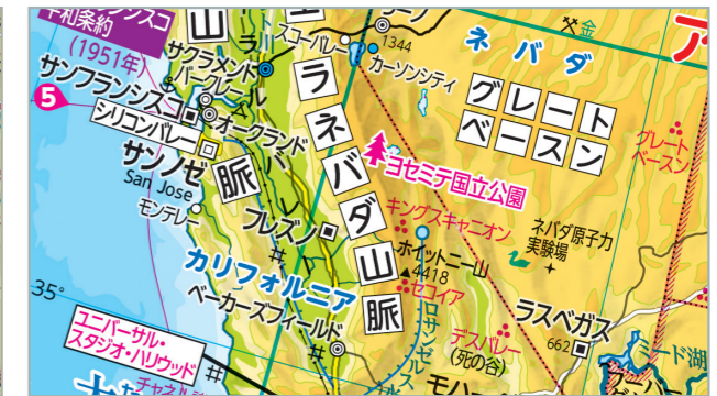
↑拡大教科書の地図帳