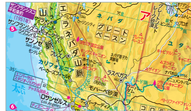
↑通常教科書の地図帳