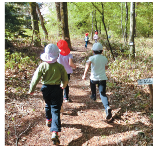
① 林間マラソンの様子。約800メートルのマラソンコースは、専門家の指導の下、子どもたちの手で整備されている。

伊那市の教育理念「はじめに子どもありき」。この言葉と林間での活動を融合させながら、私たちはこれからも、子どもたちが自ら大地に根を張り、林間という最高の教室で、高く枝を伸ばしていく姿を温かく伴走し続けていきたいと考えています。