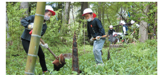
② 林間でタケノコ掘りをする4年生。