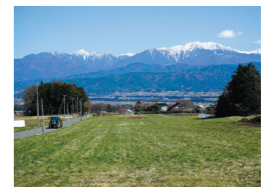
④ 学校から谷を見下ろすと、南アルプスが一望できる。