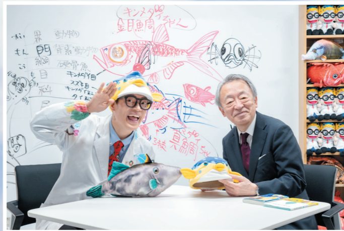
池上彰のインタビュー 今回は さかなクン

学校林である林間のマラソンコースを整備するため、子どもたちが根っこを切っている様子。